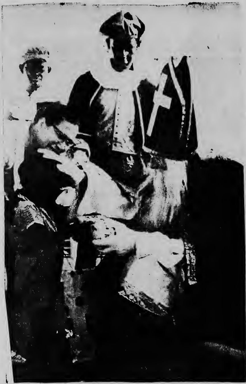
Aki nos ta mira San Nicolas poniendo su mannan santo riba cabez di un habitante chikito di Casa Cuna.